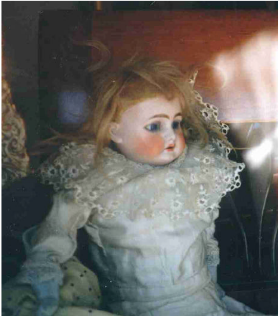
Abb. Nr. 3: Die schöne Puppe

Puppe in einem Antiquitätengeschäft in Bamberg 1988.