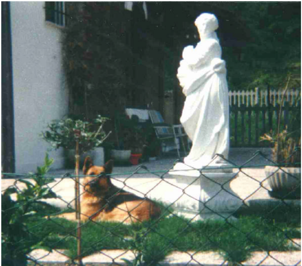
Abb. Nr. 4: Garten mit umgebendem Drahtzaun, Gipsstatue und Schäferhund Nähe Montegrotto 1997.

Hier geht es um das Zusammenkommen von Klischee und falschen Zeichen echter Bedürfnisse. Garten, Haus, Sicherheit. Darin die zu schützende Weißer Frau aus dem Bereich der klassischen Skulptur, behütet vom Deutschen Schäferhund . Im Hintergrund (eher die Realität) billige Gartenmöbel, Blumentöpfe. Vordergrund: der vor Diebstahl schützende Drahtzaun.