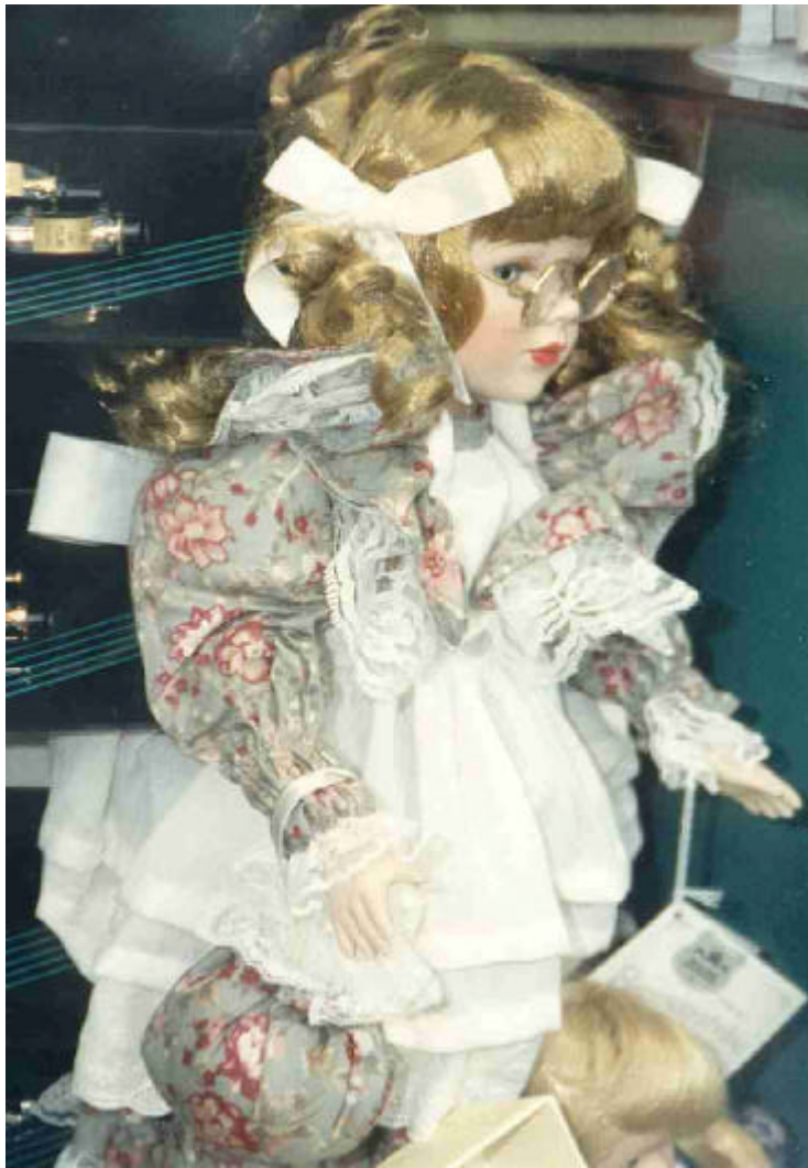
Abb. Nr. 2: Puppe mit Brille

Puppe als Reklame oder Mittel zum Zweck, im Schaufenster eines Optikers in Düren, 1998.