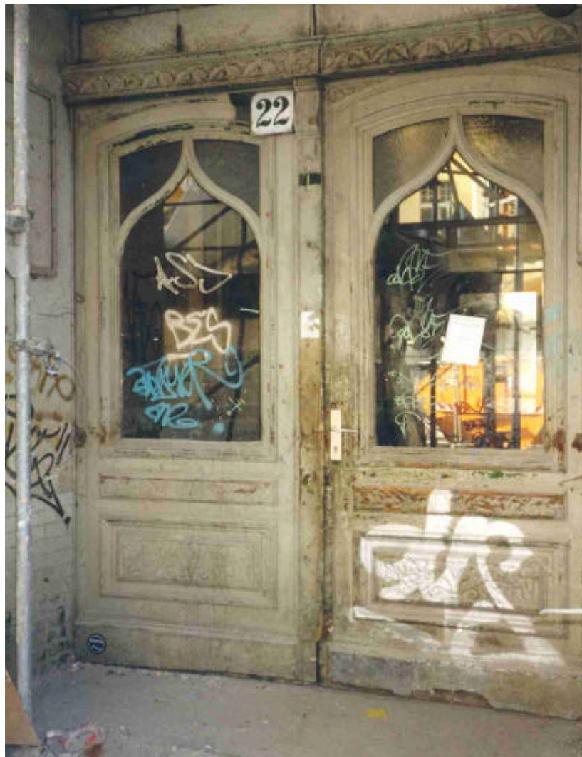
Abb. Nr. 5: Spraymotive, flächendeckend über Tür (Holz und Glas)

Malereien, Sprayermotive auf einem Gebäude, Eingang zu einem Wohnhaus in Berlin-Kreuzberg, 1999.