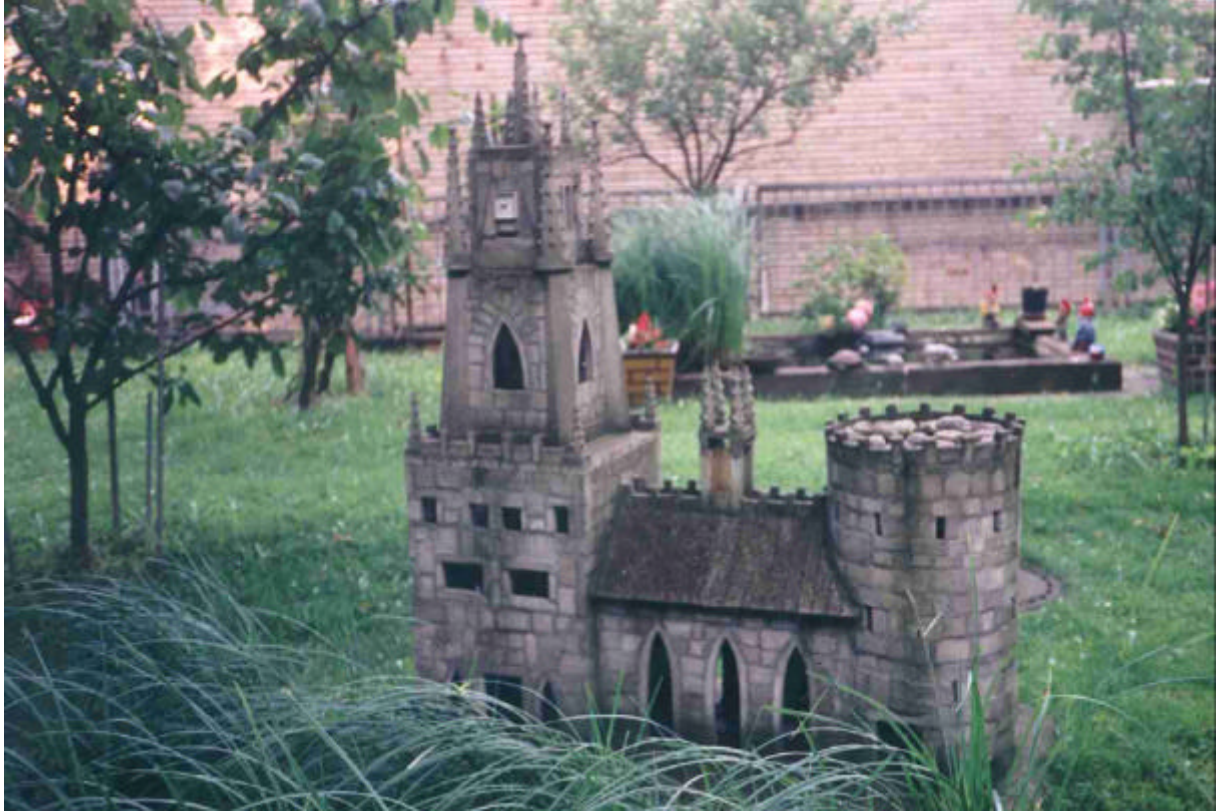
Abb. Nr. 8: My home is my castle

Garten und Mini-Burg in der Nähe der Militärring- / Bonnerstraße Köln, 1999.