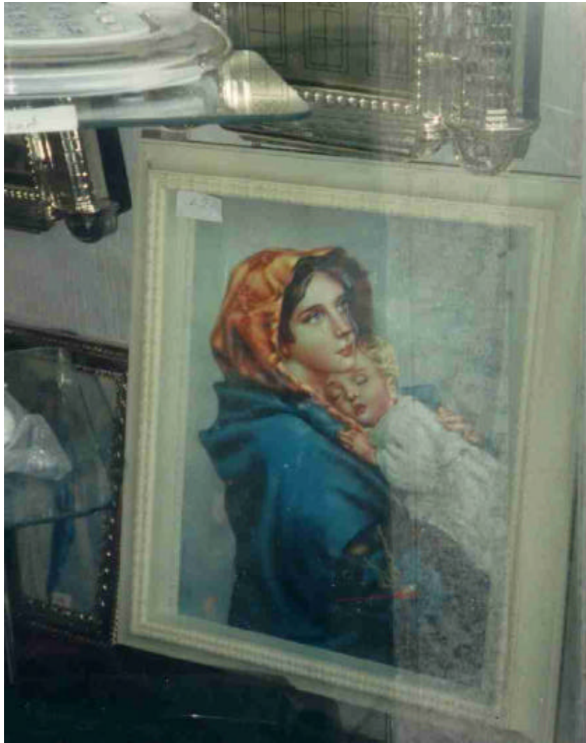
Abb. Nr. 9: Madonna, Heiligenbild

Geschenkartikel- und Haushaltswaren-Geschäft in Düren, Seitenstraße Nähe Bahnhof, 1998.