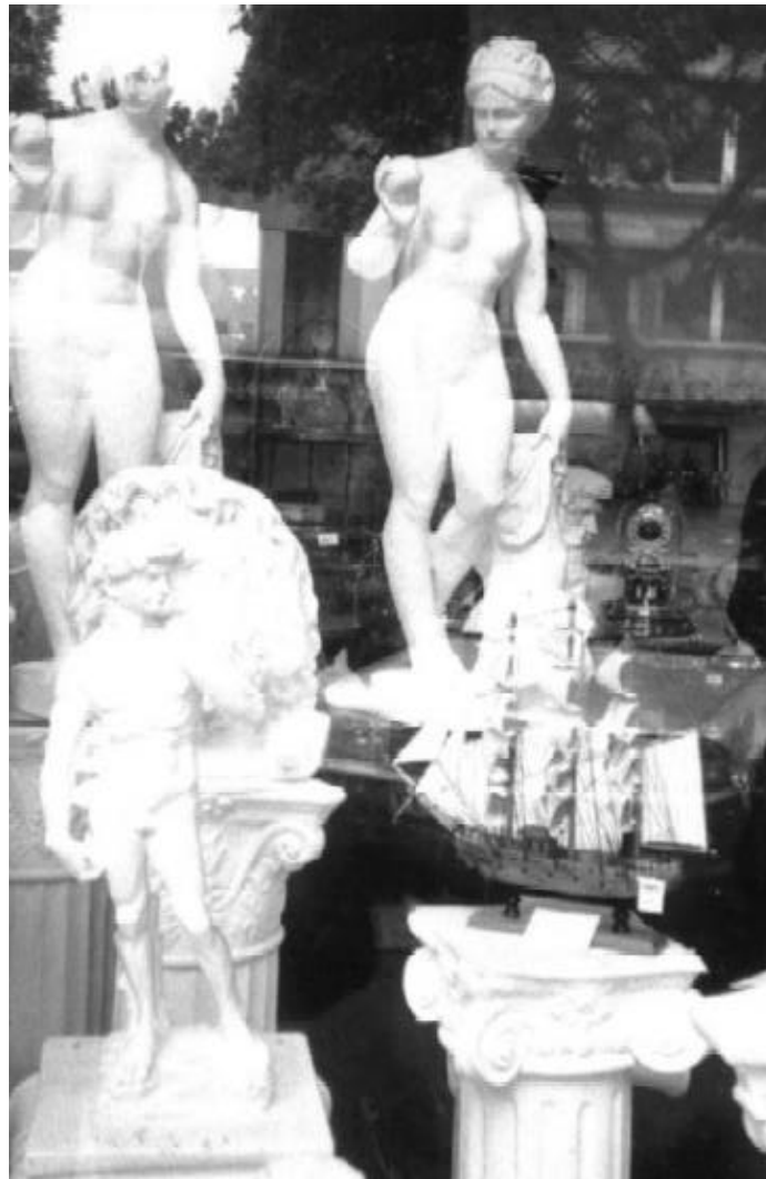
Abb. Nr. 1: Skulpturen-Idylle.

Nachbildungen, hier weiße Gipsskulpturen in einem Geschenkartikel-Geschäft in der Neuffer Straße in Köln, 2000.