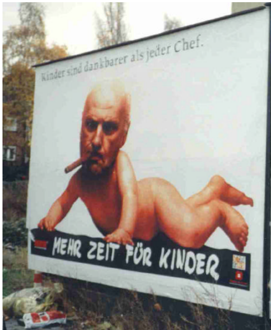
Abb. Nr. 10: Mann / Baby

Plakat in Düren, Nähe Bahnhof, 1998.